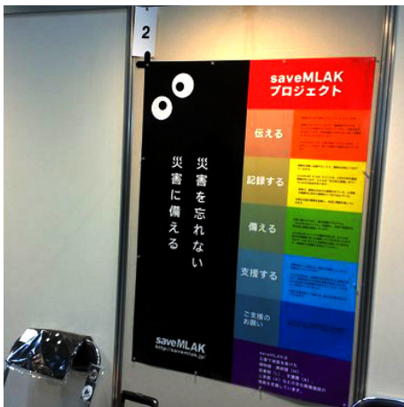
昨年のポスター発表