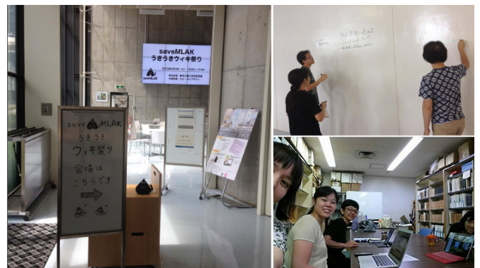
「うきうきウィキ祭り」風景

2016年9月3日(土)に「saveMLAK うきうきウィキ祭り」を開催しました。自宅でも一人でも良いし、どこかに集まって複数人でも良いし、とにかくこの日はsaveMLAKのページを編集することを目的にして、みんなが編集に取り組みました。会場としては、大阪と東京が設定され、編集が初めての方や久しぶりの方にも安心な、作業チュートリアルも実施されました。その結果、この日だけで、267箇所が編集されました！やはり、多くの方が参加し共同で編集する力は大きいですね。日々の更新を続けることは本当に大変なことです。そんな時は「うきうきウィキ祭り」などに参加し、継続の刺激をもらってみてください。当日の概要などは、 http://savemlak.jp/wiki/saveMLAK:Event/20160903 のページでご覧いただけます。