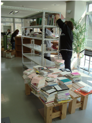
一般書配架作業中

移転先は、元の仮設図書館のすぐ隣のバイサイドアリーナ 2 階の一角にあり、一般書の書架や絨毯敷きの児童コーナーを備え、閲覧スペースやカウンターもあり、小さいながらも図書館らしい場所ができあがったと思います。しかも、仮設図書館の時よりも開架スペースが広がり収蔵能力が上がったため、開架図書を増やせることに。その結果、これまでスペースの問題から、来館者のニーズに絞った蔵書構成だった