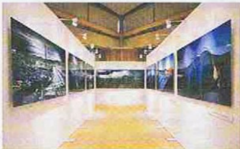
「3・11東日本大震災」写真展は沖縄コンベンションセンター会議場A2で開催中。展示会場では半田也寸志氏がサインを入れた写真集「20 DAYS AFTER」も販売する