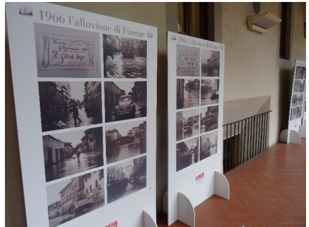
写真:フィレンツェ市内のオペラーテ公共図書館でのフィレンツェ大洪水の写真展示の様子